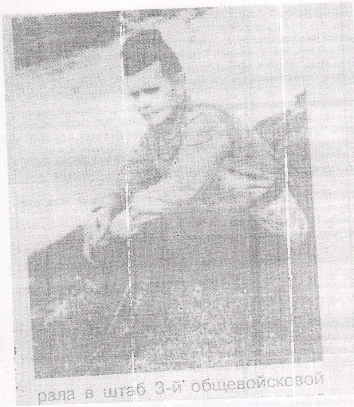
рала в штаб 3-й общевойсковой

1945 г. 10 1-й бригаде 3-й общевойсковой бригаде в бригаде 3-й общевойсковой бригаде 1-й бригаде 3-й общевойсковой бригаде 1-й бригаде 3-й общевойсковой бригаде