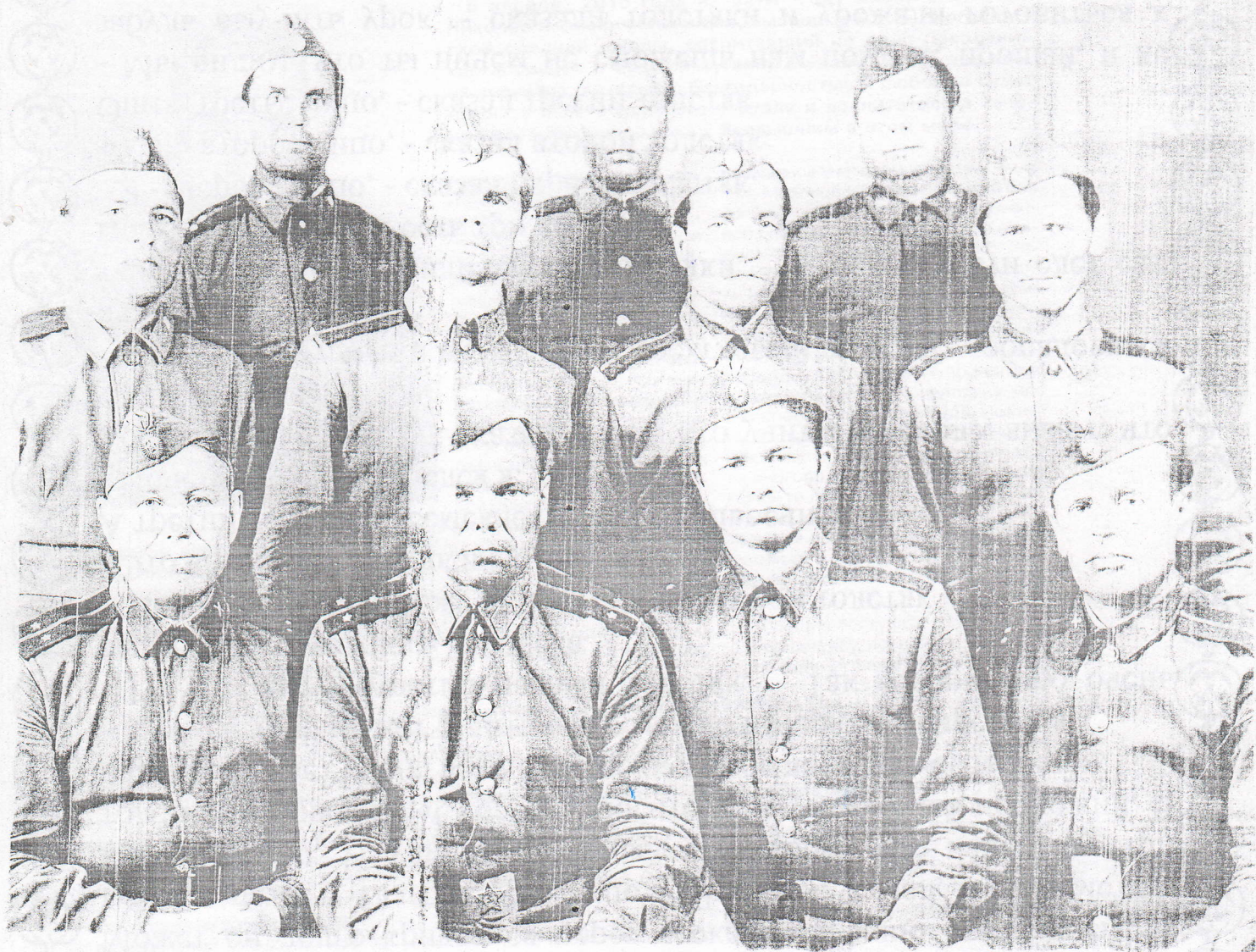
Воины запасы из офицерских сборов в г. Кургане.